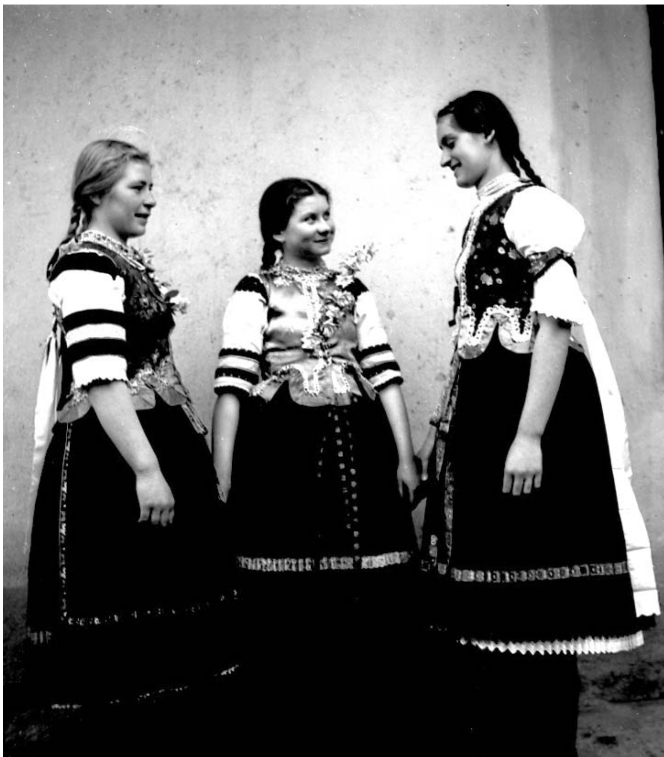
Lakodalomba készülődő lányok, Kolon