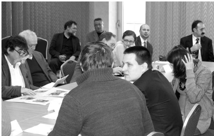
A Kerekasztal résztvevői