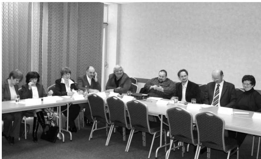
A Kerekasztal résztvevői