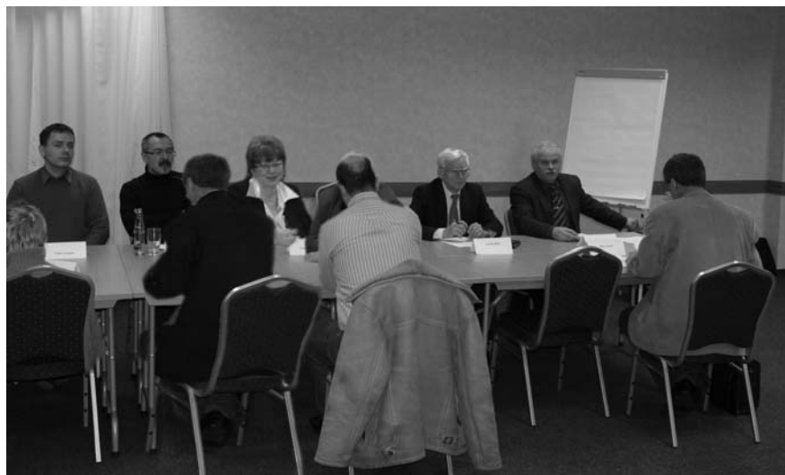
A Kerekasztal résztvevői