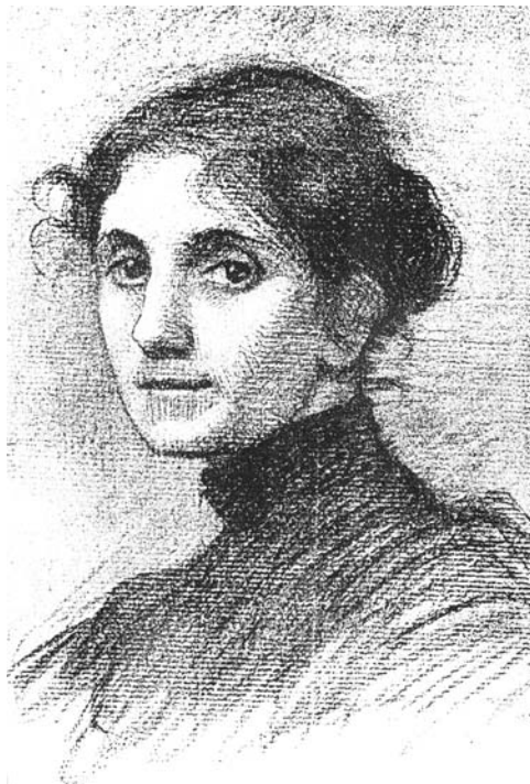
Marianne Stokes: Önarckép, 1895

A 20. század elején az Osztrák-Magyar Monarchia területére két angol festő érkezett: Adrian és Marianne Stokes. Meglátogatták a jelentősebb városokat: Budapestet, Kalocsát, Esztergomot és a kapcsolódó tájakat, a Duna mentét, a Hortobágyot, Erdélyt és más vidékeket, köztük a Magas-Tátrát is. A négy évig tartó utazásaikról részletes útirajzot adtak ki 1909-ben, Hungary címmel. Számunkra azért érdekes ez az útirajz, mert leírja a korabeli Magas-Tátrát, a Tátra-alji városkákat és falvakat, amelyeket Stokes-házaspár a mai Szlovákia területén eltöltött fél esztendő alatt meglátogatott. Valamint azért is, mivel a szerzők a könyvet 75 egész oldalas, színes illusztrációval egészítették ki, melynek csaknem a fele a Magas-Tátra vidékét és lakóit ábrázolja.