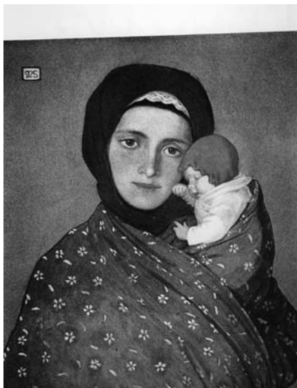
Marianne Stokes: Anya gyermekével. Menguszfalva, 1905

Adrian és Marianne Stokes-t a monarchiabeli tartózkodásuk idején, beleértve a Magas-Tátrát is, az ún. népi stílus vonzotta. A népiesség iránti érdeklődés Marianne Stokes-nál azzal magyarázható, hogy mesterségbeli tudását a müncheni Képzőművészeti Akadémián sajátította el. München a 19–20. század fordulóján annak az új irányzatnak volt a központja, amely a nemzeti újjászületést kívánta kifejezni a képzőművészet eszközeivel. Marianne Stokes érdeklődése valószínűleg már Münchenben a realista ábrázolás felé fordult, témái elsősorban a rusztikus környezet, a köznép és annak a kulturális kapcsolódó viszonya volt. Érdeklődésének köszönhetően Marianne Stokes húsz autentikus arcot örökített meg. Tipikus, egyedi alakjait Vázsec, Menguszfalva és Zsár lakosai közül választotta ki. Mivel az embereket a korabeli, mindennapi viseletükben, vagy ünneplőjükben ábrázolta, festményei egyben a Tátra-alji falvak hagyományos öltözködésének fontos ikonográfiai dokumentumai is a 19–20. század fordulójáról. Adrian Stokesnak a vázseci, menguszfalvi, zsári faházak valóságáé, realista ábrázolásait köszönhetjük, festményein megörökítette a települések épületeinek elhelyezkedését is.